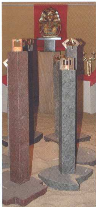
Aus der Schatzkammer: Schmückende Metall/Glas- Aufsätze für Stelen.