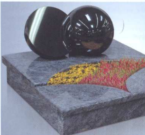
Auswahl an Neuheiten: Neben Felsen mit floralen Ornamenten wurden auch zahlreiche neue Urnengrabanlagen und Breitsteine gezeigt.

importierten Fertigprodukte mit den in den eigenen Produktionsstätten realisierten Design- und Gestaltungsvorschlägen in Konkurrenz. Hinzu