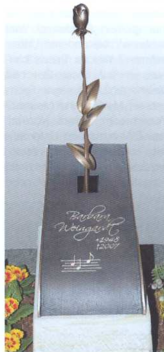
Pretiosen der besonderen Art: Neue Bronzen von Strassacker und »Remember-Rings« von Schmelzer/Heine.

Neue Formen, Materialien und Farben sind es, die eine Grabmal-Hausmesse interessant machen. Solche Neuheiten sind auch die Leuchttürme, die seit 27 Jahren im Februar den Weg zur Destag-Hausmesse in lauter-tal-Reichenbach im hessischen Odenwald zeigen. Gestaltungs- und Materialalternativen sind aber immer auch praktisch umgesetzte Ideen, und davon haben die internen und externen Designer des Traditionsunternehmens reichlich. Nicht abgehoben, provozierend, sondern dem augenblicklichen Marktgeschehen und den Bestattungsgewohnheiten angemessen. Und die sind derzeit vor allem von Vielfalt geprägt: »Es ist daher